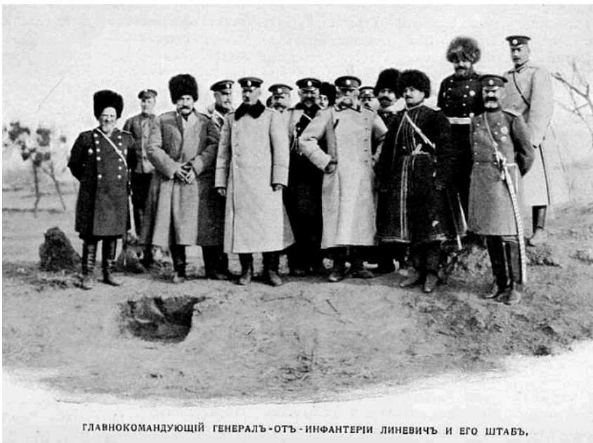
ГЛАВНОКОМАНДУЮЩИЙ ГЕНЕРАЛЬ-ОТЪ-ИНФАНТЕРІИ ЛИНЕВИЧЪ И ЕГО ШТАБЪ.

Головнокомандувач Микола Петрович Ліневич на передових позиціях (можливо серед супроводжуючих осіб присутній підполковник В.М.Данилов) Фото з ресурсу: «Дореволюционная Россия на фотографиях. Русско-японская война» http://humus.livejournal.com/1722224.html