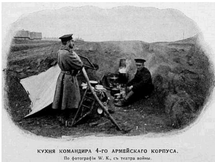
КУХНЯ КОМАНДИРА 4-ГО АРМЕЙСКОГО КОРПУСА. По фотографии W. K., съ театра войнм.

Кухня командира 4-го армійського корпусу Фото з ресурсу: «Дореволюционная Россия на фотографиях. Русско-японская война» http://humus.livejournal.com/1715856.html