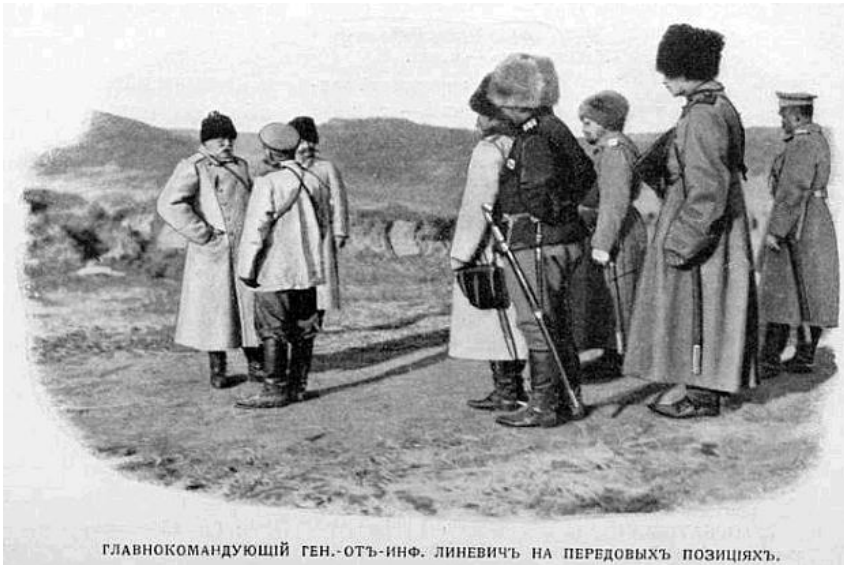
ГЛАВНОКОМАНДУЮЩИЙ ГЕН.-ОТЪ-ИНФ. ЛИНЕВИЧЪ НА ПЕРЕДОВЫХЪ ПОЗИЦІЯХЪ.