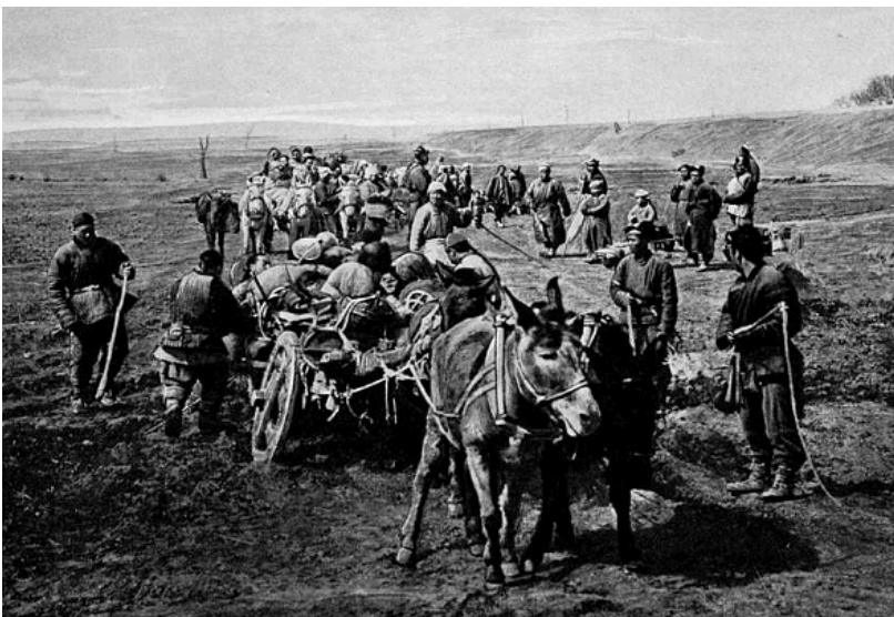
КИТАЙЦЫ БЪГУТЪ ИЗЪ СВОИХЪ ДЕРЕВЕНЬ ПЕРЕДЪ ВОЕМЪ.

http://www.vitki.org/КАК%20РОССИЯ%20ПРОИГРАЛА%20ВОЙНУ%20ЯПОНИИ.html