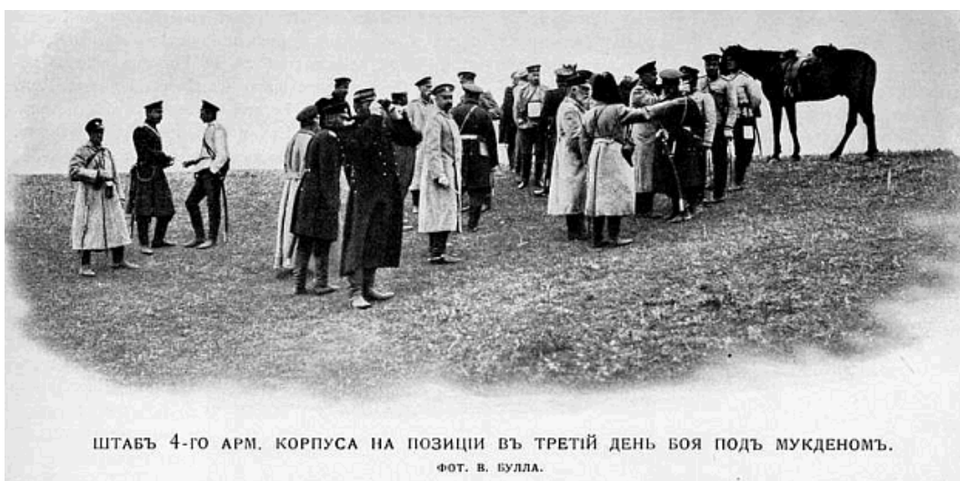
ШТАБЪ 4-ГО АРМ. КОРПУСА НА ПОЗИЦИИ ВЪ ТРЕТІЙ ДЕНЬ БОЯ ПОДЪ МУКДЕНОМЪ.

Артилерійська батарея на позиції під Мукденом