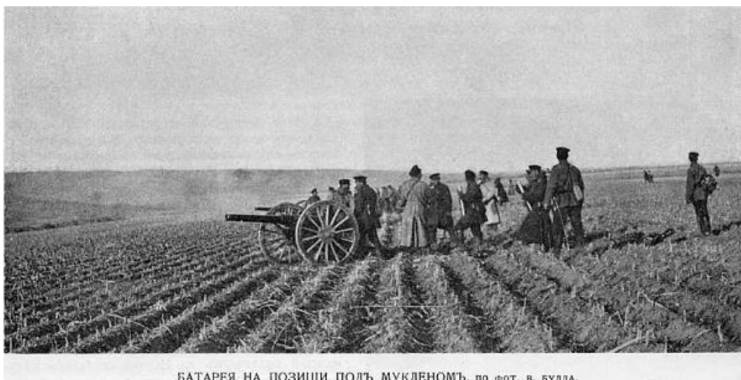
БАТАРЕЯ НА ПОЗИЦИИ ПОДЪ МУКДЕНОМЪ.

Кухня командира 4-го армійського корпусу