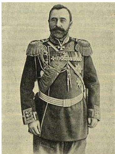
Генерал Олексій Миколайович Куропаткін програв битви при Лаояні, Шахе, Сандепу та Мукдені, після останньої поразки звільнений від командування

(ДАМО, ф. 306, оп.1, спр. 3, арк. 14–17).