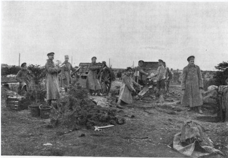
На передовых позициях. (Фот. А. Бузак).

Артилерія 8-ї армії на позиціях Першої світової війни Завантажено з ресурсу: http://lib.rus.ec/b/495338/read