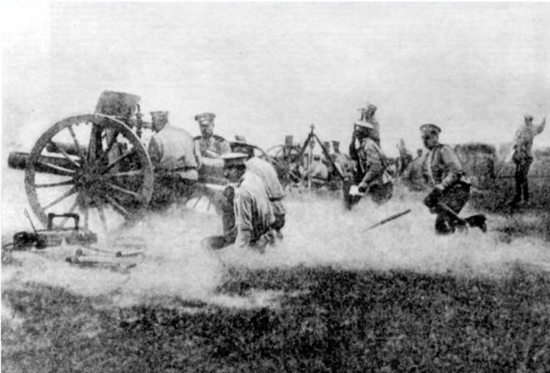
Русская артиллерия на позиции.